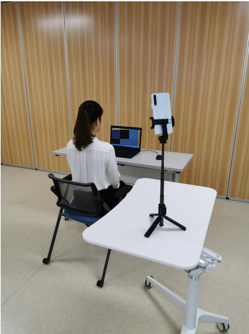
考生面试设备（含摄像头、话筒、扬声器）及侧面摄像头位置图